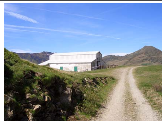
Rifugio IL Giovo (m 1706)

Continuiamo poi con alcuni tornanti, ma sempre con poca pendenza , uscendo dal bosco e risalendo il versante nord del Motto di Paraone (m. 1809).