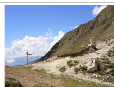
P.sso S.Jorio (m 2014)