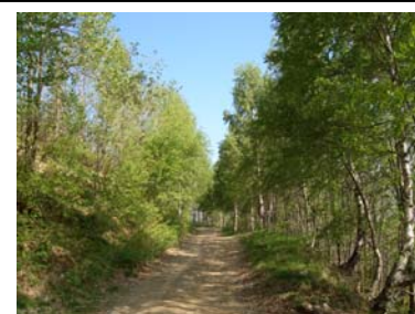
Durante la salita...