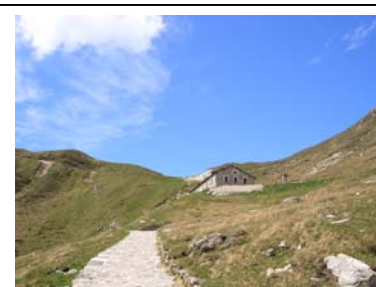
Rifugio S.Jorio (m 1950)