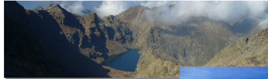
Lago della Sella

DISLIVELLO giorno1: 949m giorno2: MAX 1187m DIFFICOLTÀ giorno1: E giorno2: E/EE