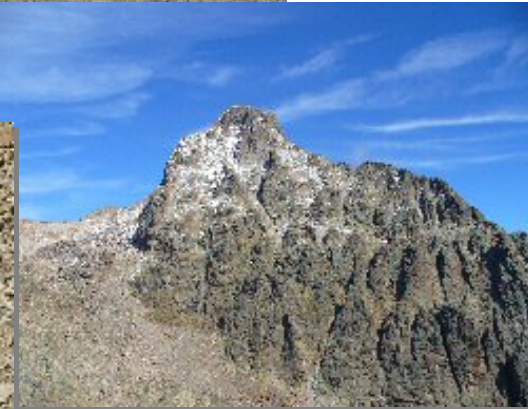
Monte Matto 3097m