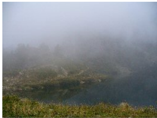
Rifugio Dante Livio Bianco

Giorno 1: si raggiunge il rifugio Dante Livio Bianco percorrendo una larga valle glaciale ricca di cascate spettacolari ed attraversando una delle più vaste faggete d'Europa. Il dislivello di 900m non deve trarre in inganno: il sentiero non presenta nessuna difficoltà e non è caratterizzato da una pendenza eccessiva. Il tempo di salita varia da 1.30 a 2.30/3 ore. Il rifugio è posto su un pianoro che sovrasta una conca glaciale occupata da un lago maestoso e dalla profondità non ancora accertata, alimentato da una delle cascate più alte delle Alpi Occidentali.