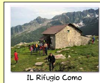
IL Rifugio Como

Dal Crotto Dangri si procede a piedi traversando il torrente su un ponte di pietra per poi proseguire su una mulattiera lastricata che porta dapprima alla chiesa di Sant'Anna e poi sale nel bosco di castagni sbucando sull'aperto poggio erboso ove sorge il nucleo di case di Baggio 949 m. A sinistra delle case il tracciato prosegue con un lungo traverso a mezza costa, lungo la sponda sinistra idrografica della valle, si avvicina al torrente di fondovalle, lo attraversa grazie ad una briglia e, con alcuni tornanti, risale sulla sponda opposta per raggiungere in breve le baite di Borgo 1055 m. Da qui il sentiero diventa meno evidente e si mantiene presso il corso del torrente, entrando in una bella faggeta (radi bolli rossi). Lasciata, a destra, la deviazione per il bivacco Ledù, che si dirama all'altezza di una seconda briglia, si prosegue sempre presso il corso d'acqua piegando verso W e sbucando sui prati presso il bel ponticello di pietra che permette di raggiungere il vicino rifugio di Pianezza 1252 m.