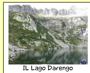
IL Lago Darenigo